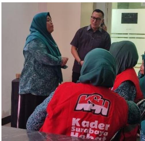
Gambar 3. Kader Praktik Langsung Kemampuan Public speaking

Posyandu. Keterlibatan langsung dalam sesi praktik ini memperkuat efektivitas pelatihan karena materi dan metode yang digunakan langsung disesuaikan dengan konteks sosial dan budaya masyarakat setempat. Kontribusi aktif mitra tersebut memperkuat dampak sosial kegiatan dan selaras dengan SDGs (LOCALISE, 2025), Tujuan 17 (Kemitraan untuk Mencapai Tujuan).