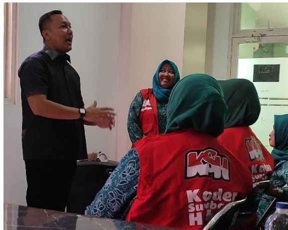
Gambar 1. KSH Memperhatikan Pemateri

menyampaikan informasi, mampu menyusun pesan yang lebih sistematis, serta lebih responsif terhadap umpan balik masyarakat.