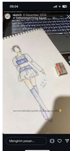
Gambar 1. Sketsa gambar Zahra Syifa Aulia untuk fashion Hailey Bieber

Gambar 1 di atas menonjolkan, gaya Hailey Bieber berhasil menampilkan gaya yang konsisten, minimalis, namun khas, sehingga memberikan persepsi profesional, modern, dan relevan. Dalam konteks ini, pengaruh Hailey sebagai acuan fashion tidak hanya berasal dari popularitasnya sebagai selebritas, tetapi dari keberhasilannya membangun identitas visual yang kuat dan relatable , yang kemudian ditiru dan disesuaikan oleh komunitas pengikutnya untuk berbagai tujuan: profesional, bisnis, maupun akademik. Fenomena ini dapat dijelaskan melalui teori komunikasi intrapersonal, yang menekankan bahwa individu akan memproses rangsangan (sensasi) visual melalui persepsi, menyimpannya dalam memori, dan kemudian melakukan proses berpikir untuk mengekspresikan diri secara konsisten. Menurut Rakhmat (2005), komunikasi intrapersonal adalah proses pengolahan informasi yang melewati empat tahap utama: sensasi (penangkapan rangsangan inderawi), persepsi (pemberian makna), memori (penyimpanan dan pengingatan), dan berpikir (penalaran dan pemutus keputusan).