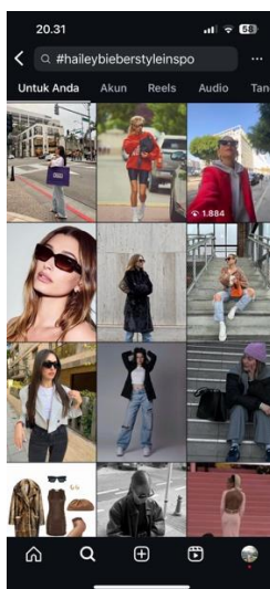
Gambar 2. Komunitas Instagram dan Tagar Hailey Bieber

Temuan ini menunjukkan bahwa gaya Hailey Bieber tidak hanya dikonsumsi sebagai konten visual, tetapi juga menjadi pemicu dialog kolektif, baik di lingkungan daring maupun luring. Gaya yang ia tampilkan menjadi semacam common language dalam komunitas mode digital yang dipahami, ditanyakan, dan didiskusikan untuk menguji apakah tren tertentu layak diikuti atau disesuaikan dengan kebutuhan lokal. Dalam perspektif netnografi, hal ini berkaitan erat dengan tahap interaksi yang digambarkan oleh Robert Kozinets. Tahap ini mencakup pertukaran simbolik, makna sosial, dan keterlibatan antara anggota komunitas digital maupun audiens suatu fenomena online .