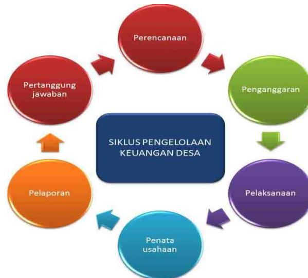
Gambar 3. Tahapan Pelaporan Keuangan Desa Melalui Siskeudes

pertanggungjawaban, mengalir secara sekuensial dalam aplikasi. Proses ini memastikan bahwa setiap data yang diinput pada tahap awal akan menjadi dasar bagi tahapan berikutnya, sehingga menciptakan siklus pelaporan yang koheren dan meminimalisir risiko ketidaksinkronan data antar dokumen keuangan.