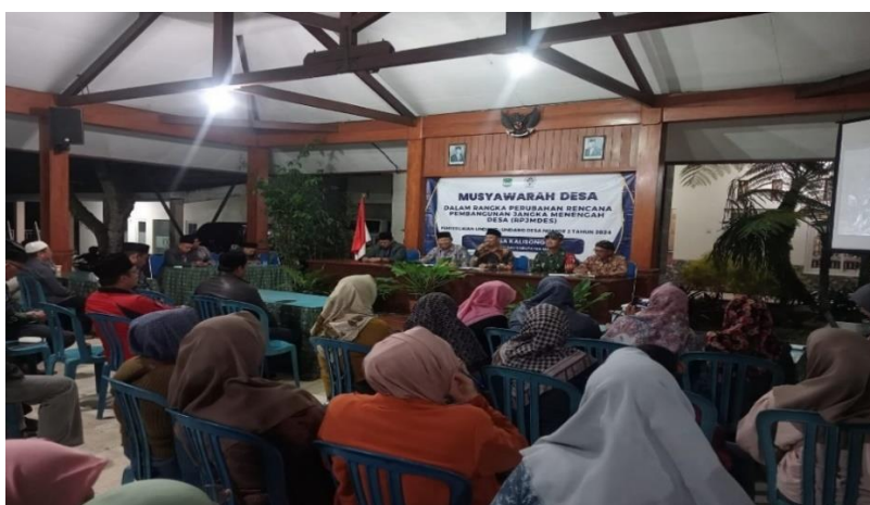
Gambar 1. Musyawarah Desa

Relevansi merupakan salah satu karakteristik utama laporan keuangan yang menunjukkan kemampuan informasi dalam memenuhi kebutuhan pengguna, khususnya dalam proses pengambilan keputusan dan evaluasi kebijakan. Informasi keuangan dikatakan relevan apabila disusun berdasarkan kebutuhan pemangku kepentingan dan berkaitan langsung dengan proses perencanaan serta pelaksanaan program desa.