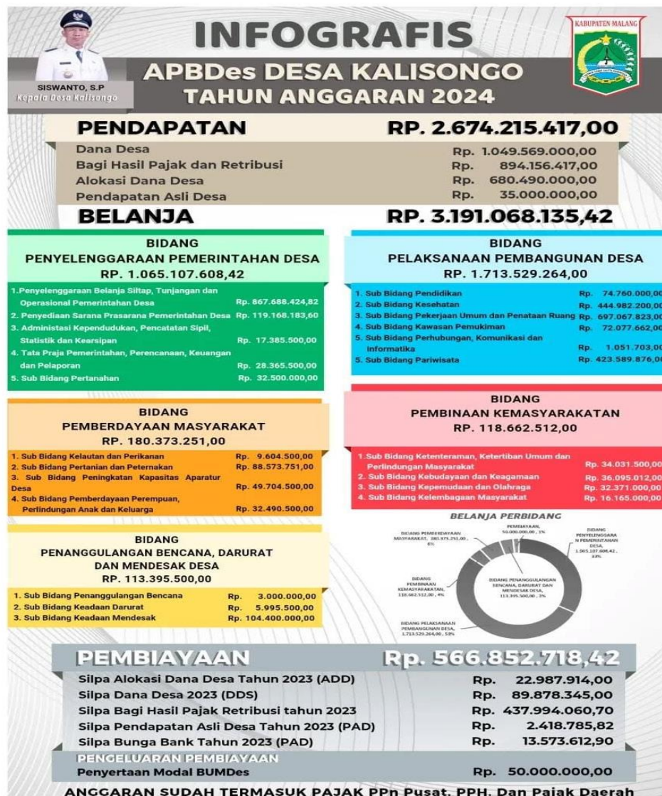
Gambar 4. Banner APBDes Desa Kalisongo

Untuk mewujudkan pelaporan keuangan yang dapat dipahami oleh masyarakat, Pemerintah Desa Kalisongo telah membuat banner informasi keuangan yang dipasang di beberapa titik strategis, seperti kantor desa dan balai desa. Penempatan banner di ruang publik menunjukkan adanya upaya pemerintah desa untuk menyederhanakan informasi keuangan agar dapat diakses langsung oleh masyarakat tanpa melalui prosedur administratif yang rumit. Banner tersebut disusun dengan menggunakan bahasa yang sederhana, jelas, dan mudah dipahami, sehingga masyarakat Desa Kalisongo dapat mengetahui informasi terkait APBDes dan penggunaan dana desa. Selain itu, pemerintah Desa Kalisongo juga memanfaatkan website resmi desa untuk mempublikasikan informasi laporan keuangan, yang memperluas akses informasi serta memperkuat keterampilan masyarakat terhadap kondisi keuangan desa secara berkelanjutan.